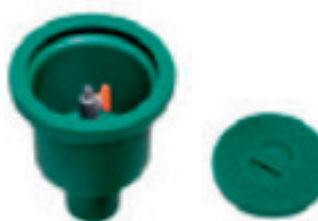
Udtag i jord - Grøn PE